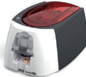
Drukarka do kart Badgy