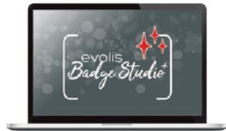
Oprogramowanie do projektowania kart Evolis Badge Studio®